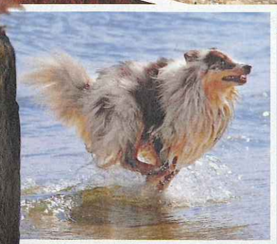
RUDELSPASS: Ob kleine oder große Hunde, alle wollten Spaß haben und fanden sich sehr schnell zu gemeinsamen Aktivitäten zusammen, die genau das für alle garantierte

Es war eine Szene, wie sie in Trassenheide, auf der Insel Usedom, wohl nicht oft zu sehen ist: 50 kleine und ein paar größere Hunden tobten fröhlich am Strand entlang, liefen durcheinander und feuerten sich gegenseitig belend an. „Und meine Chihuahuas Amy (2,5) und Bonita (1,5) mitten drin.“ Das Chihuahuaforum, in dem Sabine Lorenz sich mit anderen Hundehaltern austauschte, hatte ein bundesweites Chihuahuatreffen auf Usedom organisiert. „In Trassenheide hatte sich eine Ferienanlage mit Appartements gefunden, in der Platz für alle war. Eine sichere Umzäunung im hinteren Teil der Anlage hinderte die Hunde daran, eigene Ausflüge zu unternehmen. Da wir in der Nebensaison kamen, durften sich alle Hunde frei bewegen. Der Strand war nur etwa 300 Me-